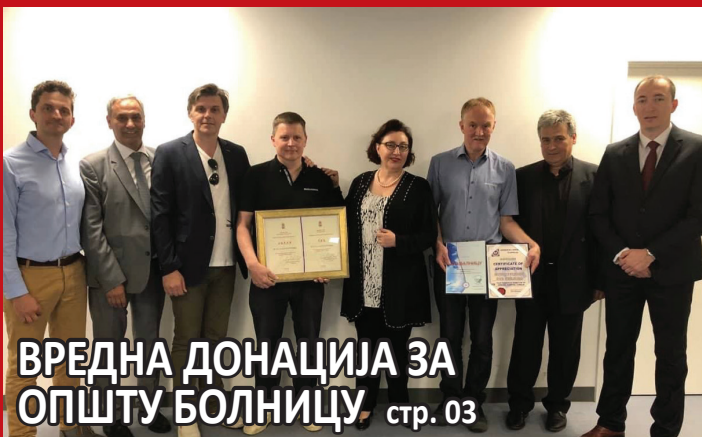
ВРЕДНА ДОНАЦИЈА ЗА ОПШТУ БОЛНИЦУ стр. 03