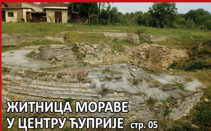
ЖИТНИЦА МОРАВЕ У ЦЕНТРУ ЋУПРИЈЕ стр. 05