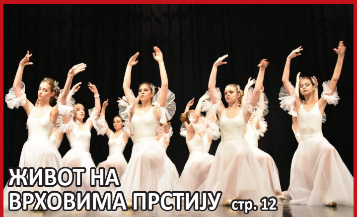
ЖИВОТ НА ВРХОВИМА ПРСТИЈУ стр. 12

БЕБАМА ЗА ДОБРОДОШЛИЦУ стр. 06 У КОРАК СА ЛЕГЕНДАМА стр. 15