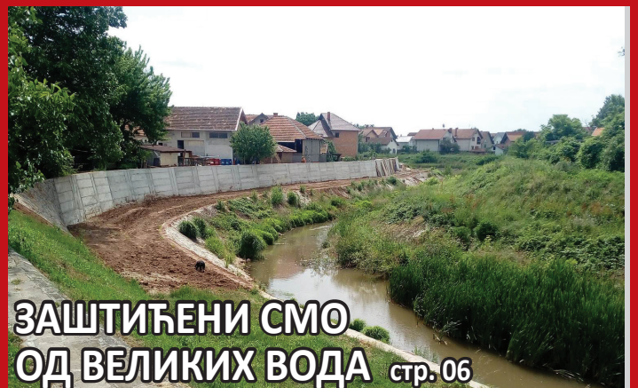
ЗАШТИЋЕНИ СМО ОД ВЕЛИКИХ ВОДА стр. 06